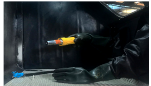
Vista interna de la cabina.